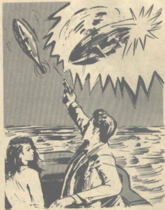
أطلق ( أدهم ) الرصاص على ذيل الطائرة المروحية ..

— هذه واحدة من منجزات المكتب رقم ( عشرة ) .. قنابل صغيرة فى حجم رصاصات